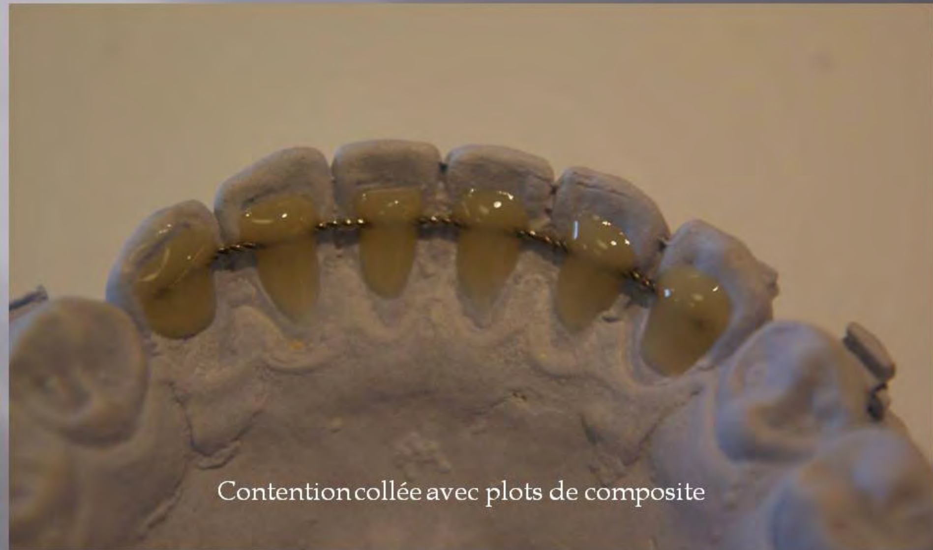
Contention collée avec plots de composite