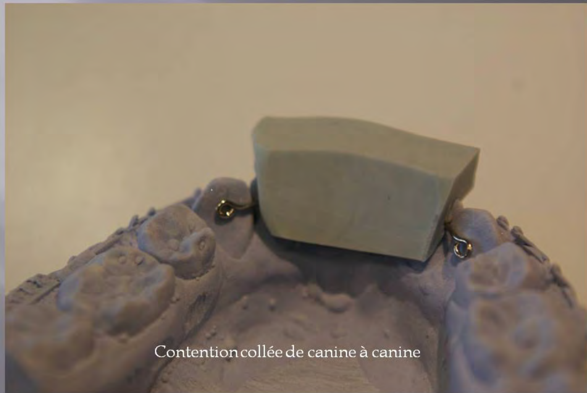
Contention collée de canine à canine